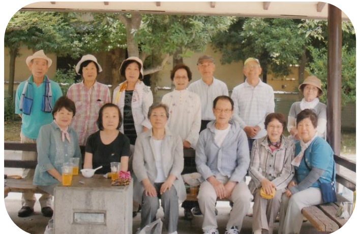
ゲーム終了で 全員集合

7月13日（木）1班～6班の 会員を主に8名が参加しました。 午前10時に安威川公民館へ集合。