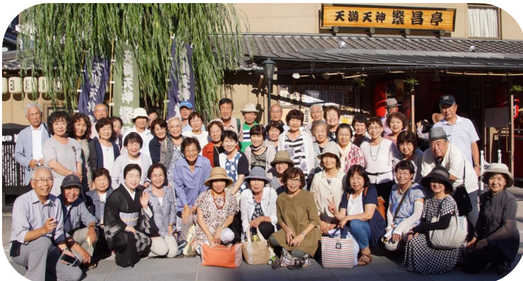
露の都師匠を囲んで記念写真