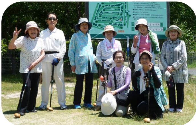
ゲーム開始前 カメラに向かって